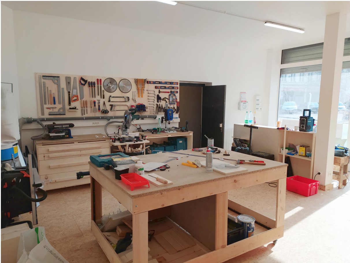
L'outilhèque, bientôt ouverte