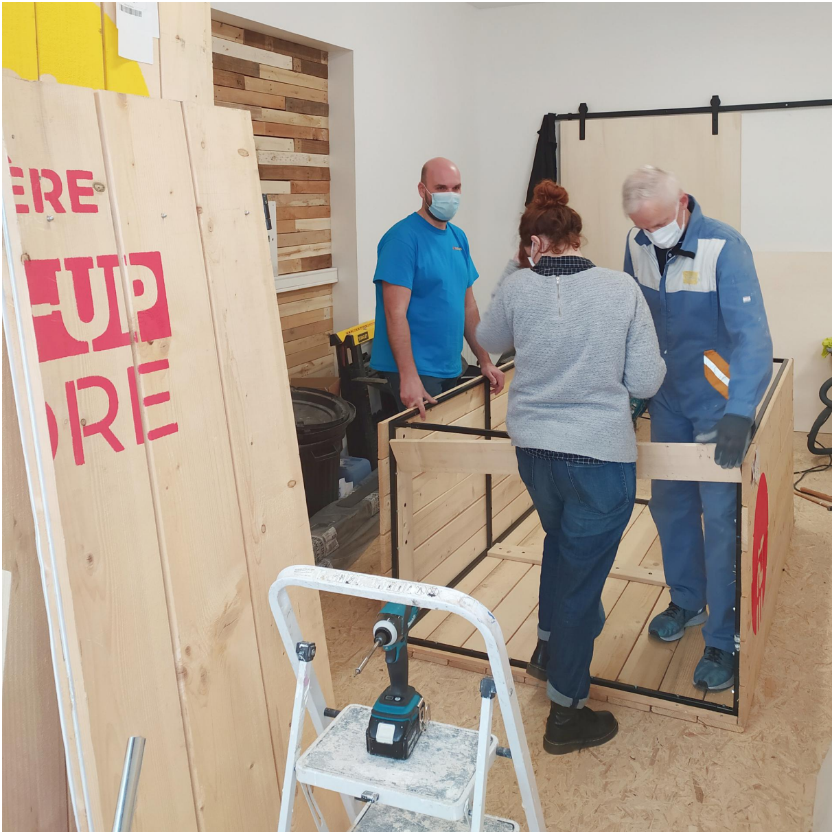
Le local en chantier